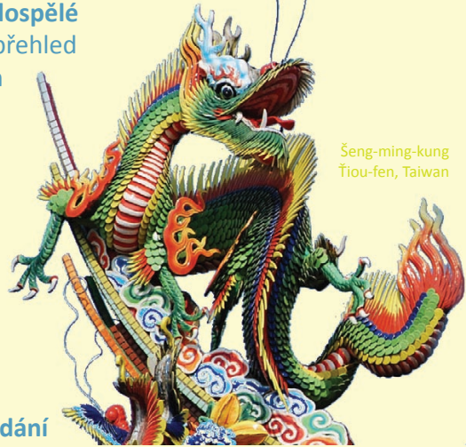
Šeng-ming-kung Tjou-fen, Taiwan